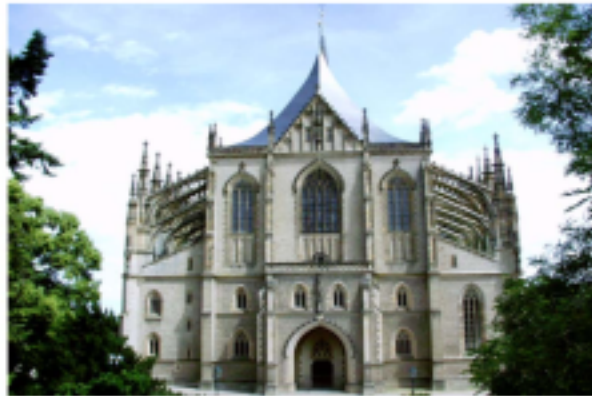
Prašná brána Vladislavský sál chrám sv. Barbory