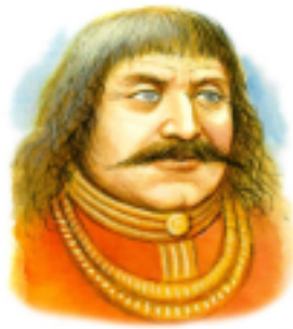
Jiří z Poděbrad